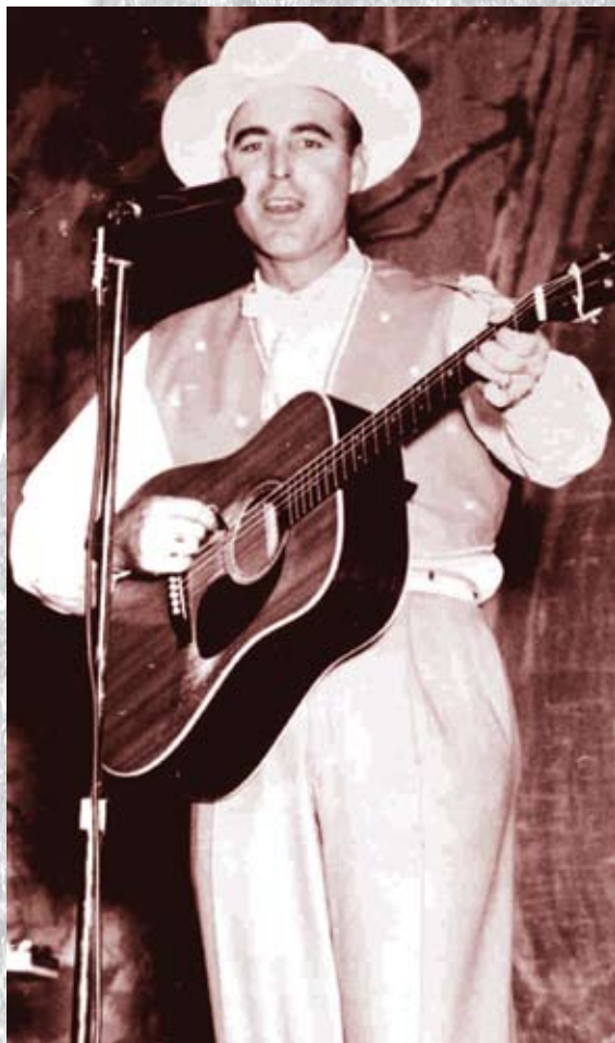
The Legendary Johnny Horton

Het is mysterieus en bijna spookachtig dat Johnny's laatste optreden in de Sky Line Club in Austin, Texas was. Op weg naar huis op route 79 bij het plaatsje Milan werd Johnny door een dronken student aangereden. Alleen