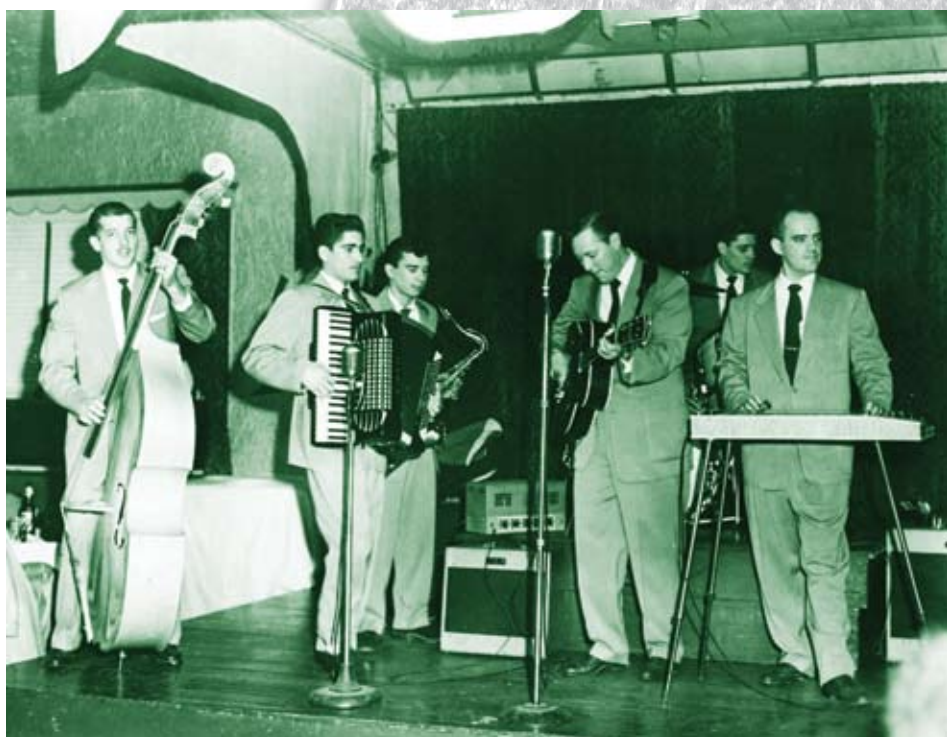
Bill Haley & his Comets