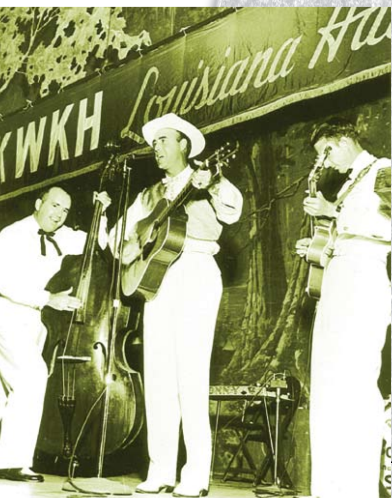
Johnny Horton op de Louisiana Hayride

In '56 scoorde Johnny zijn eerste C&W-hits Honky Tonk Man en I'm A One Woman Man. In '57 volgde mijn favoriete en meest rockende song I'm Coming Home (waar Johnny zelf aan mee geschreven had) en ook The Woman I Need. Al deze