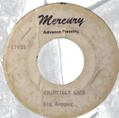
45 USA Advance pressing A