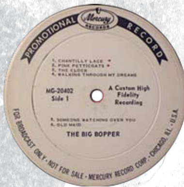
LP USA Promo

Jape had ook voor Donna Dameron de single Bopper 486609/ Big Love geschreven. Beide nummers hebben een Big Bopper-beat en op het einde van Bopper 486609 is hij zelf ook nog te horen.