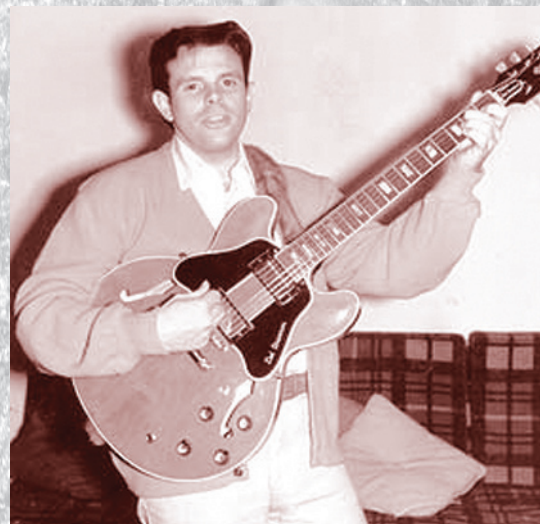
Del Shannon met GIBSON

wezen zoals sommige andere blanke nieuwkomers uit die tijd dat wel waren. Er kwamen datzelfde jaar meer hits zoals Hats Off To Larry (#5 pop in juni) en So Long Baby (#28 pop in oktober). Het jaar daarop was