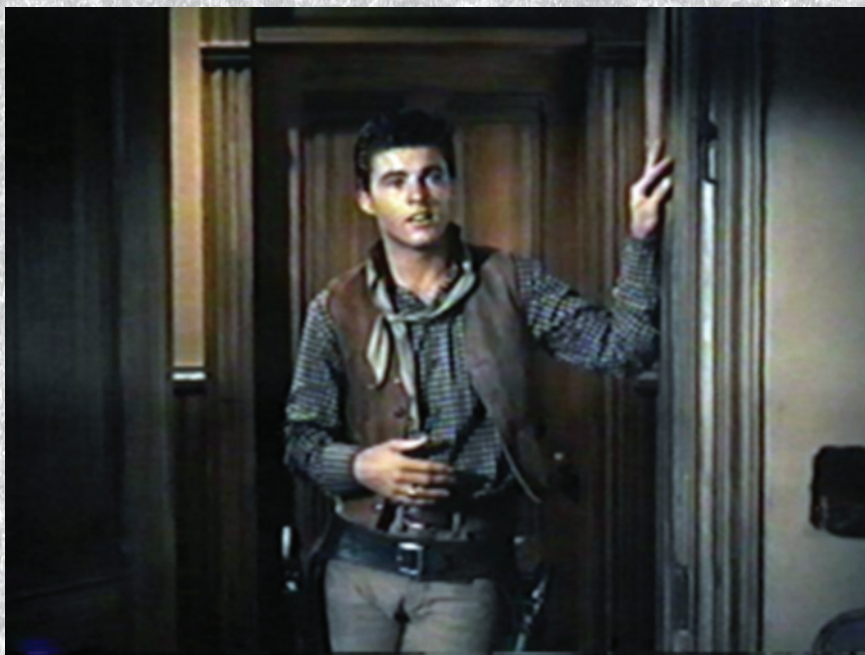
Ricky Nelson in Rio Bravo

Ricky had een paar jaar daarvoor zijn artiesten naam veranderd in Rick Nelson en was net voor 1 miljoen dollar naar Decca Records over gestapt. Maar na 1964 had ook Rick Nelson te lijden onder de Britse invasie en hij scoorde niet meer in de top 40. Totdat hij in januari 1970 met een nummer geschreven door Bob Dylan, She Belongs to me #33 pop scoorde. Dit leek een toevaltreffer te zijn en er zullen maar weinig mensen ooit gedacht hebben dat Rick nog een keer in de top 10 terug zou komen. Maar in september '72 gebeurde dit toch en Rick haalde zijn laatste hit in Amerika en ook zijn tiende en laatste gouden plaat met de countryballade