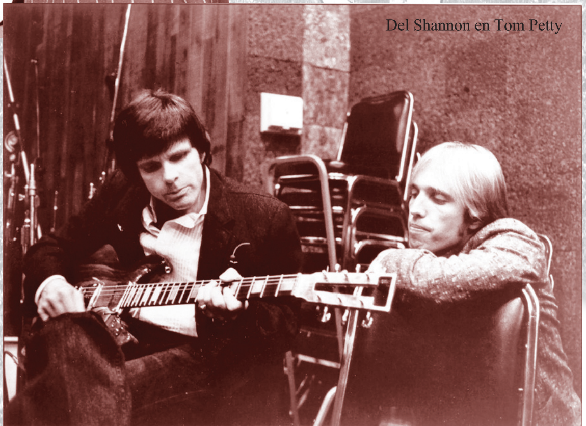
Del Shannon en Tom Petty

minder succesvol en alleen Hey! Little Girl haalde de top 40. Maar Del was nog steeds een ster en in januari '63 scoorde hij wederom een grote hit met Little Town Flirt (#12 pop en # 4 in G.B.). Dat bracht hem op tournee in Engeland waar hij de opkomende Beatles ontmoette tijdens een gezamenlijke optreden op 9 mei '63 in de Royal Albert Hall in Londen. Del was onder de indruk van één van hun nummers: From Me To You. Toen hij terug in Amerika was coverde hij het en was daarmee de eerste Amerikaan die een Beatle-nummer coverde. Bovendien werd dankzij Del Shannon From Me To You het eerste Lennon/ McCartney nummer dat in Amerika de charts haalde,